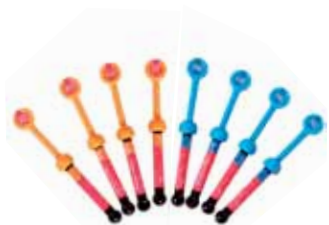
Gradia Direct Anterior / Posterior / X