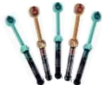
G-aenial Anterior / Posterior